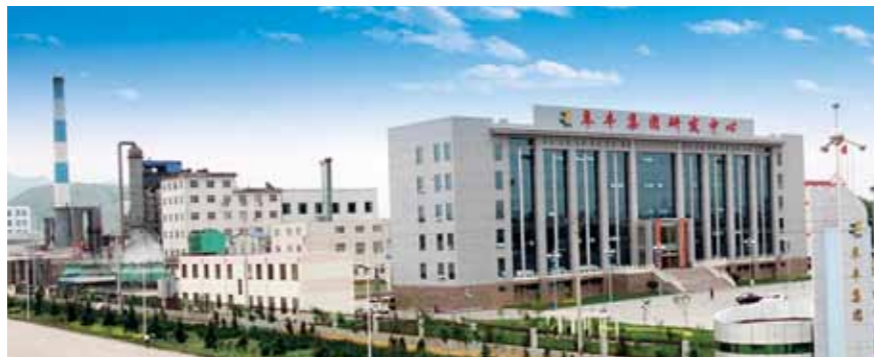
Fábrica de Shandong

mesmo tempo, mudará o foco de desenvolvimento que sempre foi de expansão da capacidade de produção para uma melhoria dos padrões de qualidade dos produtos e uma eficácia global. Também continuará a desenvolver ativamente novos produtos de alto valor agregado e alta margem de lucro para impulsionar o crescimento do negócio no futuro.