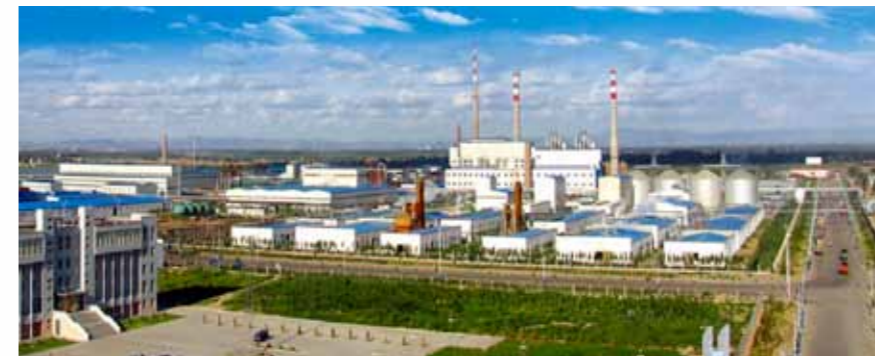
Fábrica de Hohhot

3) Em 2012, o Grupo construirá uma fábrica na região de Xinjiang para produção de alguns produtos aminoácidos de primeira linha. Isto lhe permitirá aproveitar os ricos recursos minerais do lugar - abundância de carvão! - para desenvolver produtos de ponta em aminoácidos, com vantagem de custo. Tentará ingressar fortemente no mercado high-end e se fixar solidamente nele. O objetivo do Grupo, a curto prazo, é se tornar um dos três