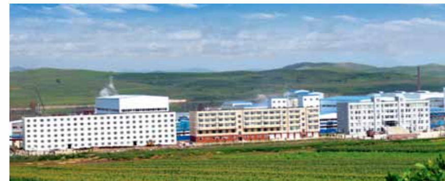
Fábrica de Hulunbeir

maiores produtores e fornecedores mundiais, em market share , de três a cinco produtos aminoácidos de primeira linha. O desenvolvimento e a produção desses produtos deverá melhorar e diversificar o mix de produtos do Grupo, atendendo assim diversas demandas do mercado. Para alcançar os objetivos acima mencionados, o Grupo pretende melhorar a organização da gestão, continuar a atrair e desenvolver talentos, e alavancar os padrões da cultura corporativa. O Grupo Fufeng contratou uma empresa de consultoria que atuará na gestão e estratégia de negócios. O consultor irá auxiliar o Conselho de Direção na avaliação, racionalização e melhoria dos atuais sistemas de gestão e recursos humanos do Grupo e elevará os padrões de sua cultura corporativa. O Grupo acredita que essa melhoria será capaz de beneficiá-lo no desenvolvimento de longo prazo.