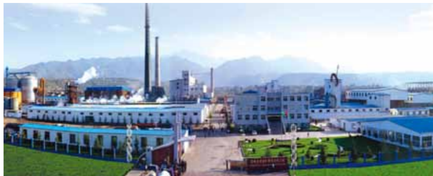
Fábrica de Baoji

Com anos de esforços, o Grupo estabeleceu uma sólida liderança no mercado. Em 2012, manterá as realizações do passado e criará novos motores de crescimento. O Grupo continuará a manter as economias de escala, as vantagens de custo e o domínio do mercado; ao