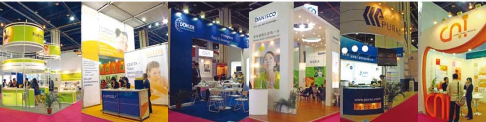
Algumas das empresas de atuação internacional em sua participação na FIC 2009.

responderam por aproximadamente 30% da exposição.