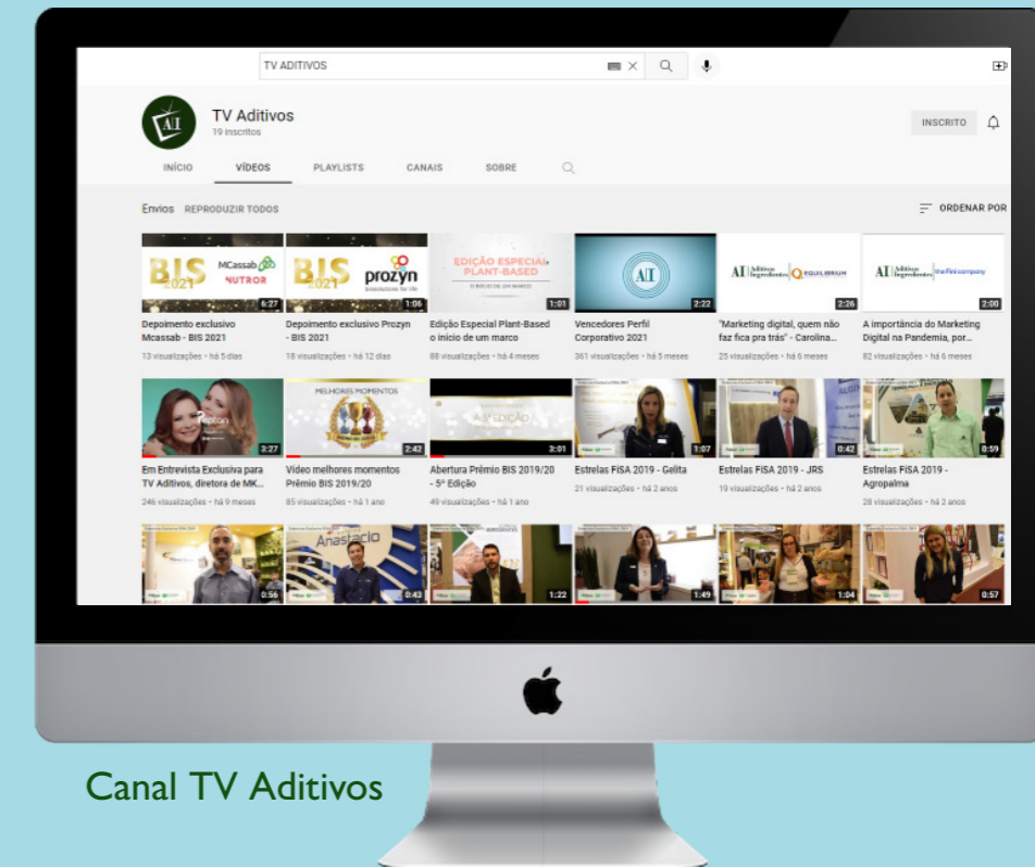
Canal TV Aditivos

Ferramenta que soma ao nosso mix de mídia, a TV Aditivos dialoga com os novos tempos. Oferecemos espaço para o seu executivo apresentar lançamentos, contar em canal direto suas inovações, expor posicionamento olho no olho do mercado. Não fique para trás e explore mais esta ferramenta.